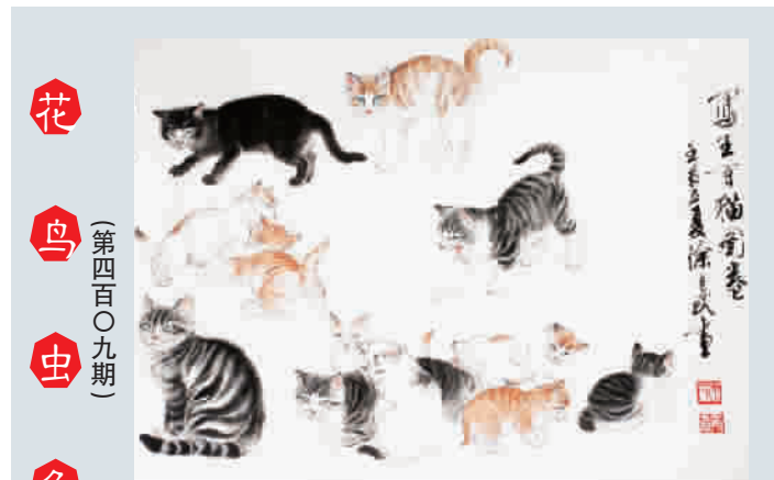
写生百猫图卷(局部)

这条宠物蛇果然很乖,并没有什么抵触动作。后来我才知道,宠物蛇的性情一般比较温和,大多是无毒的,并不是我想象中的“洪水猛兽”,有一些还蛮可爱的呢!