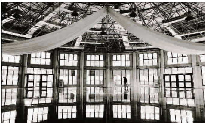
■ 黑白 1933 —— 摄于老场坊