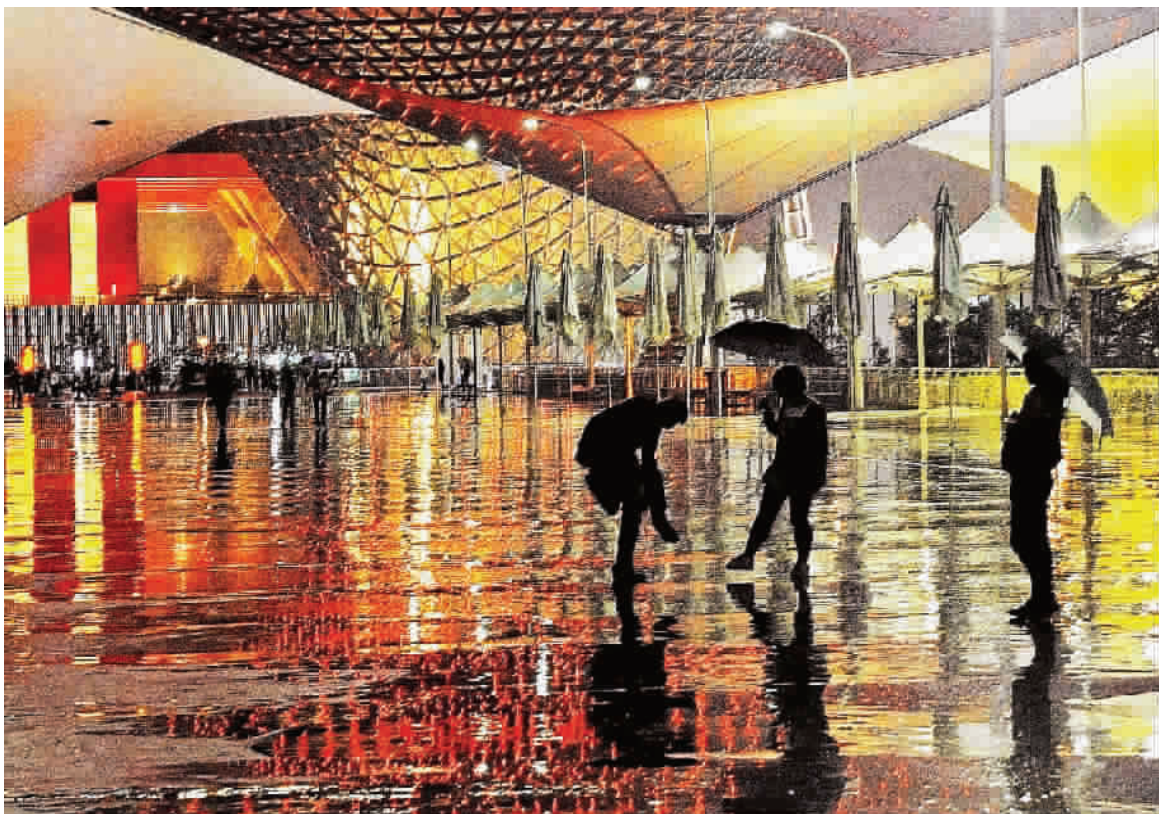
■ 霏霏秋雨 浓浓情致 摄于世博中国馆