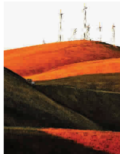
■ 低碳之谷 摄于美国加州