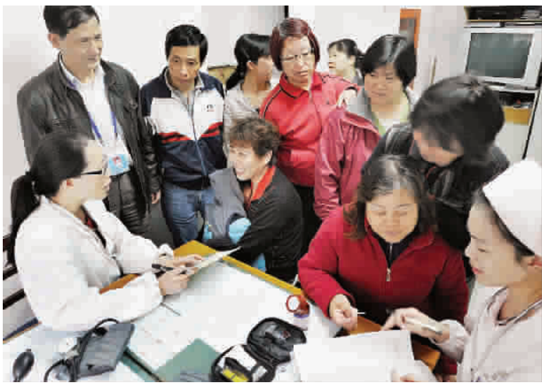
定期在居委会为签约家庭提供健康咨询,极大地方便了病人

现在,殷行社区卫生服务中心有家庭医生33名,为2800多户居民服务。杨浦区从去年底开始在殷行和延吉两个社区先行推行家庭医生服务,现共有137名家庭医生,全区签约1.2万户,覆盖居民总数达5.5万人。