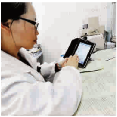
签约病人的病史资料都被一一登记