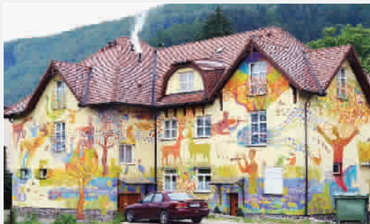
■ 建筑墙面上美丽的画面