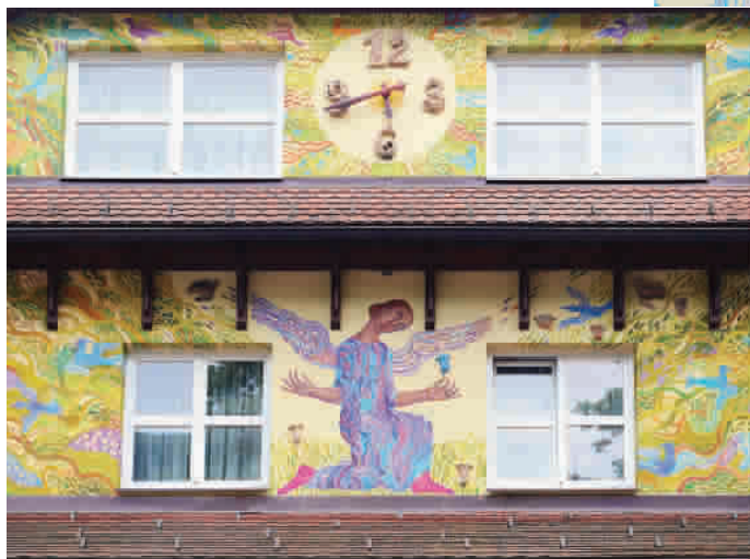
■ 房屋外立面彩墙设计师,显然是把当地最著名的神话故事,用漆画形式“涂鸦”到这幢房屋外,让游客停留在此进行丰富的幻想,这种环境美术在欣赏的心理上就获得了成功 均姜锡祥 摄

位于 M50 创意园区旁的莫干山路涂鸦墙曾经是无数艺术发烧友争相留念的艺术地标,那 600 多米的墙壁上留下了国内外许多艺术达人的杰作,充满活力与时尚气息。现如今,它也顶不过“命运”,很有可能在年内被拆除。值得关注的是,在得知涂鸦墙即将消失的消息后,无数网友纷纷表示要赶紧趁着它还健在,再去最后跟这个被网友称为“上海最惊艳的涂鸦墙”留个念告个别。这里的涂鸦充满趣味性,给许多人带来过视觉的享受,并不是一些丑陋而浮躁的情感宣泄,完全称得上是上海最具代表性的建筑