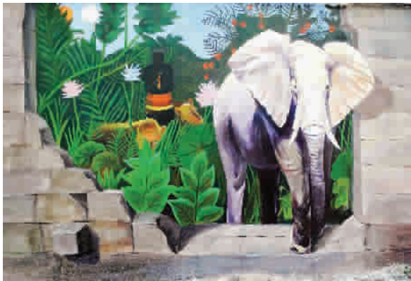
■ 2010年7月22日清晨,浙江温岭市区锦屏南路,在锦屏公园还未建成的停车场围墙上,一头栩栩如生的大象正要“穿过”破损的围墙,逼真的立体涂鸦引路人驻足观赏 (图1C)