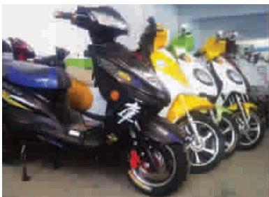
东川公路有商家销售超标电动车