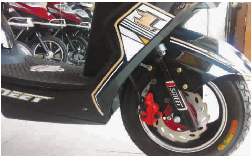
改装过的电动车车速可达60公里每小时,并配备了类似摩托车的刹车系统