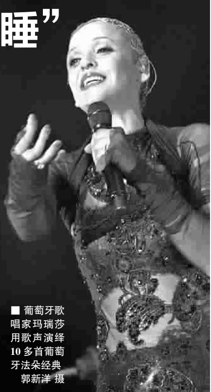
■ 葡萄牙歌唱家玛瑞莎用歌声演绎10多首葡萄牙法朵经典

音乐会结束时，大雨依然骤密，陆家嘴中心绿地周围的建筑灯光只能隐约可辨，草坪上的观众不得不奔进篷房避雨。被迅猛雨势暂时挡住回家脚步的听众戏说：“今夜真的难以入睡了。”