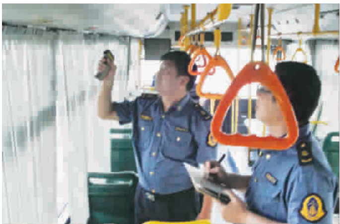
检查人员正在测试公交车出风口的温度