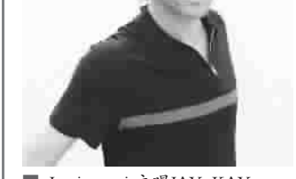
Jamiroquai 主唱JAY KAY

首届无懈可击亚洲巅峰音乐节 Sonic Shanghai 2013 将于8月17日、18日举行，除了先前已经确认的美国摇滚乐队 Limp Bizkit、新金属乐队 Korn、中国摇滚乐队黑豹及音乐才子李泉之外，人气歌手韩庚以及范晓萱、杨乃文、杨宗纬也将代表华语音乐势力加盟。世界顶尖的英国乐队杰米罗奎尔乐队（Jamiroquai）将于8月6日在上海大舞台热力开唱，率先打响音乐节头炮。杰米罗奎尔乐队有着非常古怪的名字，这个队名取自于某个印第安部落名“Iroquois”和爵士乐最重要的元素——“Improvisation”（即兴），他们通过近20年的乐队生涯，跻身世界最顶尖的舞曲团体。自1993年发表首张专辑《地球告急》（EMERGENCY ON PLANET EARTH）至今恰好二十年，在这二十年里，杰米罗奎尔在全球卖出了2000万张唱片，对于