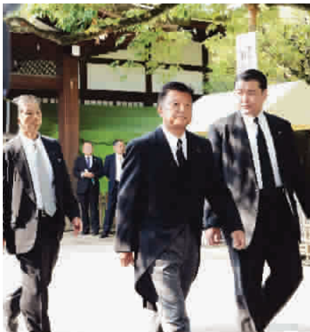
今天上午,日本总务大臣新藤义孝(右二)到靖国神社参拜

据日本共同社及时事通讯社报道,日本首相安倍晋三今晨已向供奉有二战甲级战犯牌位的靖国神社献上“祭祀费”。截至发稿时,安倍内阁的两名成员及 50 名国会议员今天已前往靖国神社参拜。