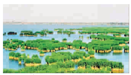
沙湖一奇芦苇迷荡