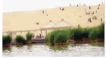
玩沙的娱乐项目也很多