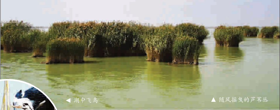
随风摇曳的芦苇丛