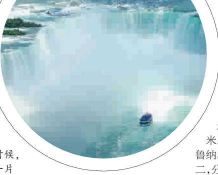
▶ 当小船靠近它的时候,满眼的雾水,白茫茫一片