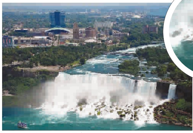
▲ 美国“新娘的面纱”洁白,梦幻 ▼ “马蹄”瀑布如雷电轰鸣,排山倒海