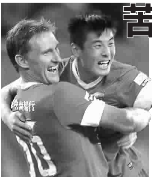
上港队球员凭实力，为上海足坛赢回一点颜面

申花客场败走恒大，申鑫在源深不敌阿尔滨，如果昨晚出战的上海集团也输球的话，沪上三支球队本轮将遭遇尴尬的全军覆没。好在，年轻的“上港队”没有令人失望，2比0拿下杭州绿城，为上海足坛赢回了一点颜面。 三个星期的休战期过后，上港队给人一种耳目一新的感觉，完全没有了德比战输给申花的郁闷。面对绿城，主队也准备得更充分，他们利用娴熟的配合组织多次有威胁的进攻。杭州绿城队则有些发挥失常，缺少了主力外援马佐拉的突破，全队几