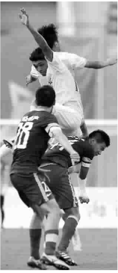
申鑫(白)昨战大连阿尔滨，场面不可谓不精彩