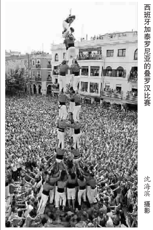
西班牙加泰罗尼亚的潘罗汉比赛