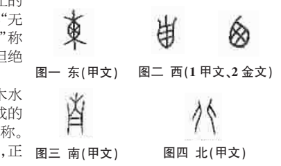
图一 东(甲文) 图二 西(1甲文、2金文) 图三 南(甲文) 图四 北(甲文)

北,“背”的古字,甲文构形如背对着背的两人(图四)。两人相背为北。另有站立之人身影朝北之说,但证据悬悬。在中华汉字库的东西南北,到处是我们需要提取的文化“粮盐”。