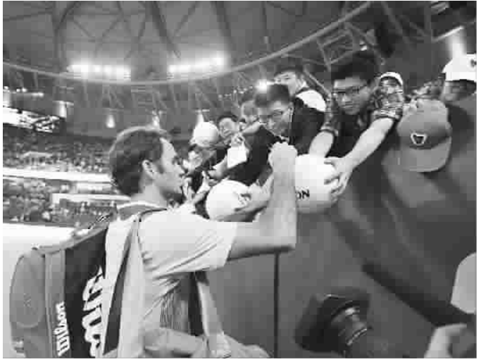
费德勒双打首秀晋级后,为现场的粉丝签名