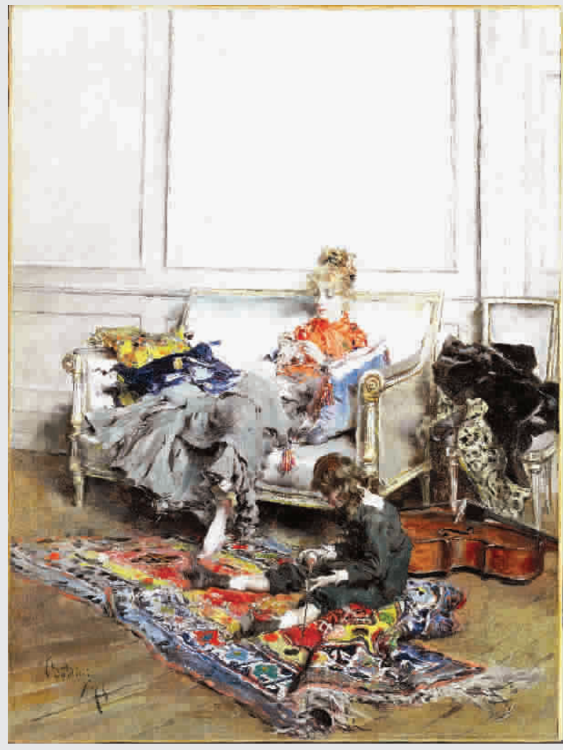
波蒂尼《做钩针的女子》