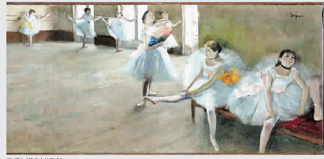
德加《教室中的舞者》