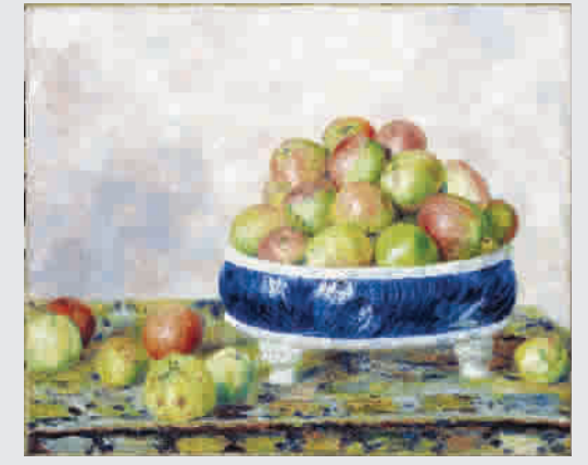
雷诺阿《盘中的苹果》