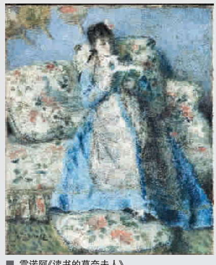
雷诺阿《读书的莫奈夫人》