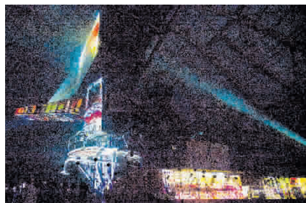
■ 大型空间影像作品《洪流》将信息流投影在巨大的搅拌机上