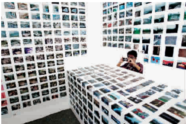
■ 图片完整记录了国家体育场的建设过程