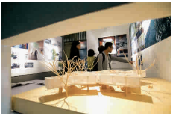
■ 展馆里陈列了大量中国当代建筑家的作品模型