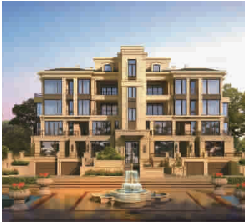
上海买房呼叫中心 4006358880 转 900

据项目销售负责人透露,此次推出的房源,目前所剩的房源已不多。同时,富力湾还将于近期应市场要求加推一批房源。