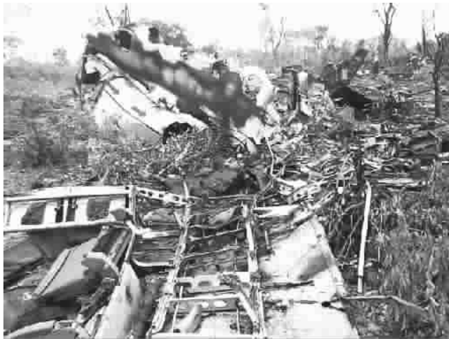
莫桑比克客机坠毁现场

客机失事地点位于巴博瓦塔国家公园,地处纳米比亚东北角一片狭长地带,被夹在博茨瓦纳与安格拉之间。