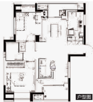
威廉公馆「百年宅」90m² 两房两厅

无障碍设施 全屋无障碍门槛, 方便婴儿学步车、轮椅通行。厨卫采用集成化设计, 淋浴、坐便器旁安装扶手, 保障家人安全。