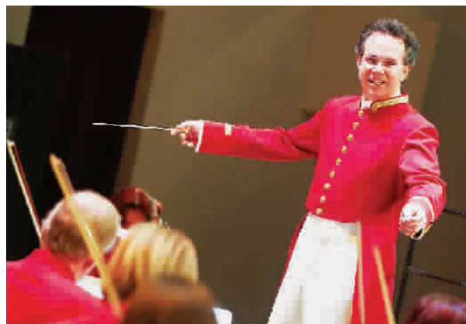
■约翰·施特劳斯乐团又将登台

指挥大师艾森巴赫与祖宾·梅塔的加盟,让元旦前后的新年音乐会“星光熠熠”。艾森巴赫是上交推出“世界名家新年音乐会”系列后的第五位指挥家,他为这台“2014上海新年音乐会”选取了柴可夫斯基、格林卡和拉赫玛尼诺夫的作品,简短精致的乐曲十分适合营造热烈气氛。祖宾·梅塔率领首次访华的西班牙瓦伦西亚皇后歌剧院交响乐团,先于明年1月2日上演汇集了西班牙作曲家和施特劳斯家族作品的专场,3日将演出由贝多芬《第八交响曲》、柴可夫斯基《第四交响曲》等组成的交响音乐会,让乐迷们在欢度新年之际过把“交响瘾”。大提琴家王健则将与其7次获得格莱美奖的指挥大师伦纳德·斯特拉金合作,1月3日与法国里昂国立管弦乐团登台上海音乐厅;而拥有“听交响,到东方”口碑的东方艺术中心则邀请了名家名团相伴听众,汉堡交响、柏林交响、