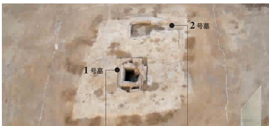
▲ 空中俯拍隋炀帝墓全景

2号墓出土了成套编钟16件、编磬20件,是迄今为国内唯一出土的隋唐编钟编磬实物;玉璋1块,是古代天子出外巡游时祭祀山川用的,也是高等级身份的象征;一个至今散发光芒的凤冠,凤冠上镶嵌琉璃珠,有