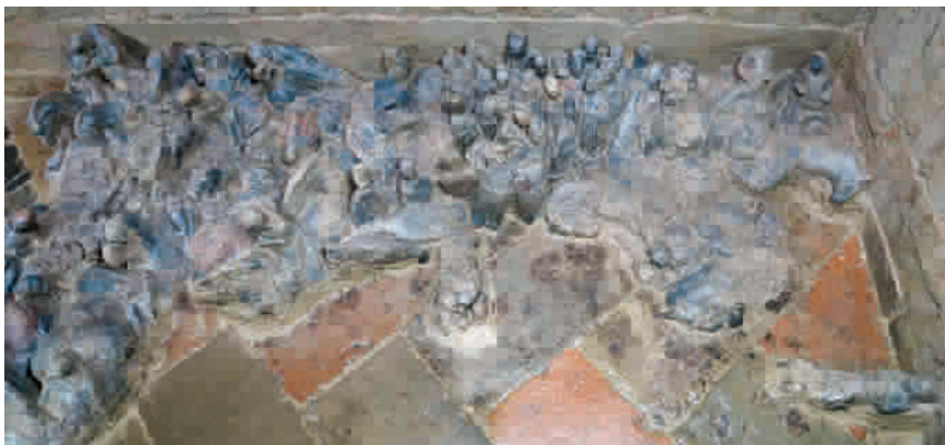
■ 1号墓西耳室陶俑出土情形