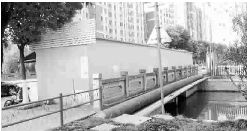
水果摊疏导点占用人行道