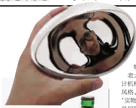
▲ 哈哈镜 ▼ 钢牙

“晒上海”就是上海设计师们为设计行业的多元化和丰富性而做的努力，以独立的精神，自己做自己的甲方，发出最直观，无保留的声音，为上海设计之都做出更多的铺垫。在忙碌而又现实的本职设计工作之外，保留那一片竹林，去培育着我们的设计奇葩。有一天，某朵奇葩可能成为改变我们生活的设计，但也可能只是林中有奇葩。