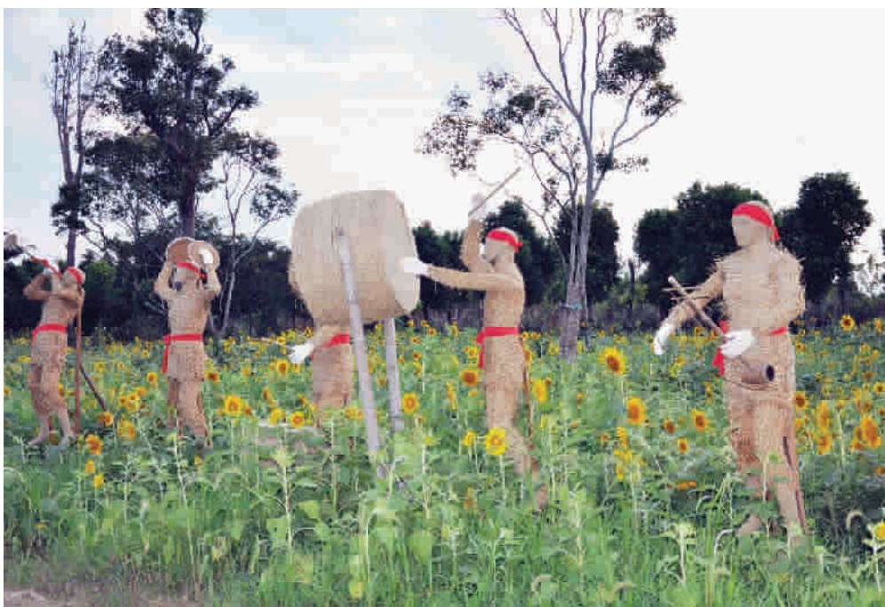
■ 向日葵田里的稻草人