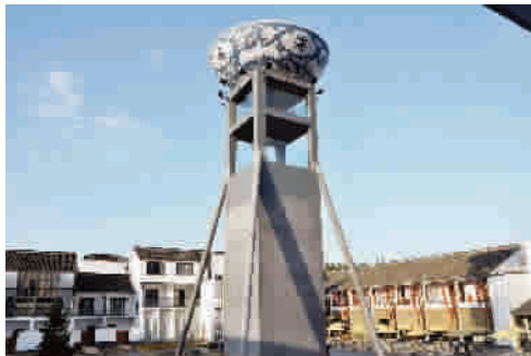
■ 菜园广场的海碗,喻示丰年足食

马年春节,不出上海市你也能过一个别致新年。坐轨交 16 号线,白相滴水湖,在东方菜园吃浦东八样农家菜,感受沪上本土原住民气息。