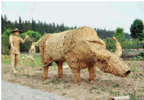
■ 稻草扎成的耕田图