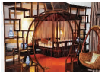
■ 古董老宅里的陈设