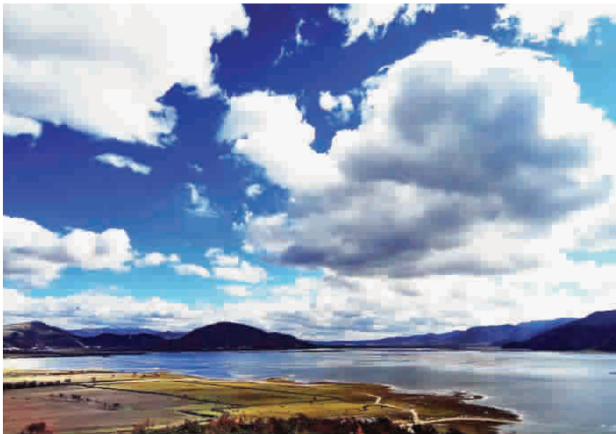
■ “三江并流”景区，蓝天白云好空气

保山境内的自然名胜也雄奇瑰丽，有99座火山，并与88处温泉相伴而生，世间罕见；高黎贡山坐拥“世界生物圈保护区”和“三江并流”世界自然遗产两项桂冠；还有磅礴壮观的怒江大峡谷、富饶美丽的潞江坝、魅力无限的和顺古镇、宁静优美的银杏村、野趣横生的樱花谷、一派水泽风光的北海湿地，都让人惊艳不已。而且，当地空气绝对优良，蓝天白云，风轻气爽，是换气佳地。推荐以下几处不可错过的名胜和游线：