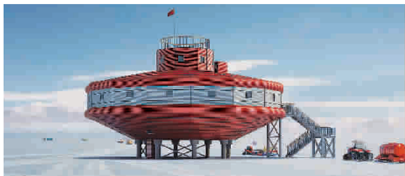
■ 南极泰山站主体建筑透视图