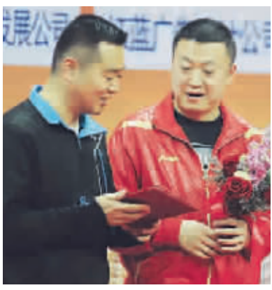
孔令辉(左)与马琳在交谈