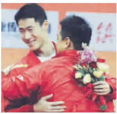
王励勤(左)与王皓拥抱