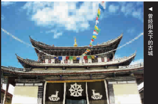
曾经阳光下的古城