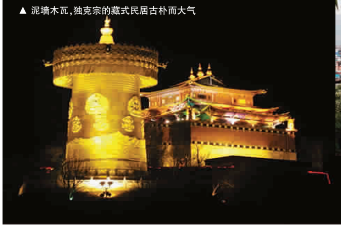
▲ 泥墙木瓦,独克宗的藏式民居古朴而大气