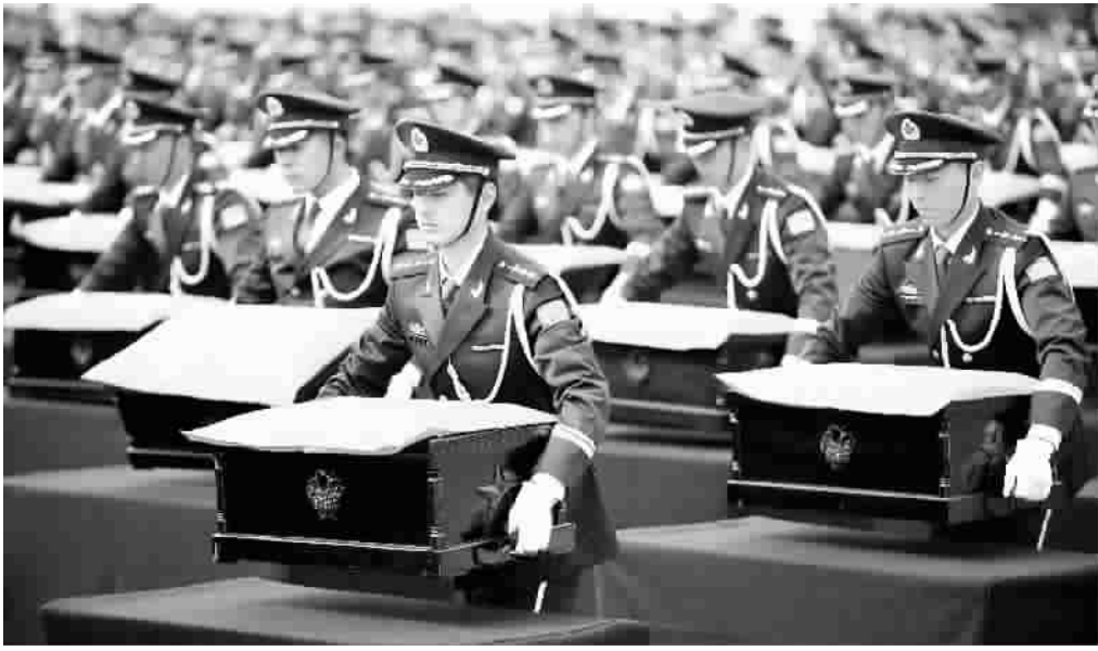
礼兵护送覆盖着国旗的棺椁进至棺椁摆放区