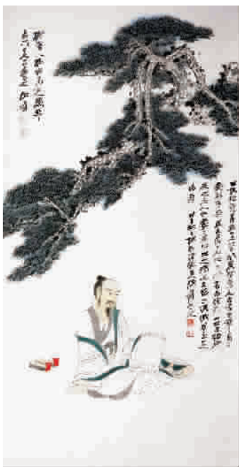
■ 张大千《拟唐人孙位高逸图》

作为 1948 年的此幅作品, 正值大千艺术创作年富力强之盛年。这段时间恰逢抗战胜利以后, 因避战离开大陆后终于再度返回家乡, 常住青城山, 得闲历游峨眉等名山大川, 使得大千的身心颇为舒畅。加之敦煌之行的积淀, 和因缘际会收获了一批北宋名迹(郭熙、李成、范宽、董巨等宋元大名家都包含在其临学之列), 过着整日与名画、名胜朝夕相对的日子, 实为大师一生中不可多得的闲适巅峰状态。近年来最受海内外收藏界关注和追捧的张大千作品大多也出自这个时期。此幅作于乾隆纸上的松下高士题材作品, 当属典范。