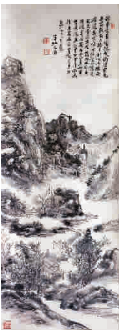
■ 黄宾虹《仿董巨山水》