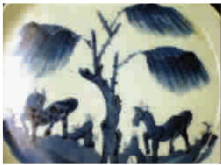
古代民窑青花瓷数康熙为上,其发色青翠靓丽,纹饰拙中见巧,内容以反映渔樵耕读等农耕文明

的生活场景为主,备受藏家青睐。康熙“玩玉”款柳荫憩马纹盘,高2.7厘米,直径18.5厘米,斜直壁,折腹,足圈径14厘米。盘内底主题画面为青花柳荫憩马纹。画面中央为枯枝新芽迎风拂起的柳树。树两侧分绘二马,前马圆斑点身,回首扬尾;后马仰头竖耳,嘶鼻抬足,二马眉目传情,前呼后应,栩栩如生,背景衬以萌发的春草和通灵剔透的山石,给人以春意盎然,生机