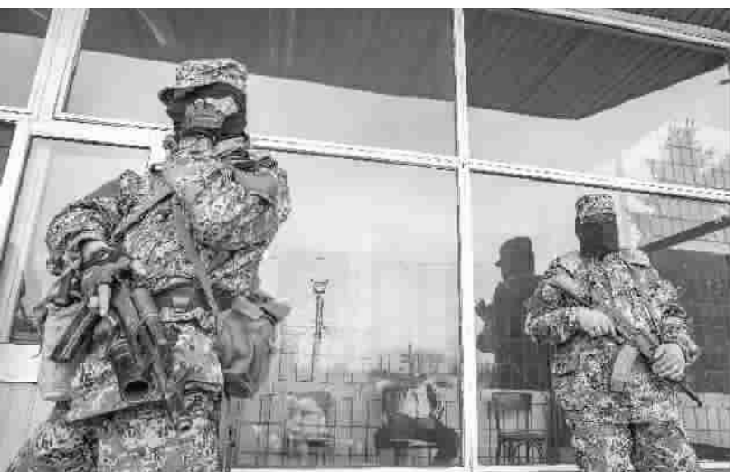
康斯坦丁诺夫卡反政府武装人员占领市政厅

本报特稿 乌克兰东部乱局28日呈现蔓延之势,反政府武装人员又占领一座城市市政厅,哈尔科夫市市长遭遇枪击。28日上午,一伙武装人员占领顿涅茨克地区康斯坦丁诺夫卡市市政厅和警察总部。康斯坦丁诺夫卡市有8万人口,位于顿涅茨克州首府顿涅茨克市与斯拉维扬斯克市中间地带,后两座城市目前均在反政府武装人员控制之下。另一东部省份哈尔科夫州首府哈尔科夫市市政府28日证实,对中央政府持反对立场的市长克尔涅斯当天遭枪击重伤。据报道,克尔涅斯是在公路上骑车兜风时中枪的,被送到医院时因失血过多已经昏迷。医生说,克尔涅斯胸腹部受伤,一些器官受损,今后几天仍会有生命危险。警方在事发现场找到一枚7.62毫米子弹,枪手使用的很可能是狙击步枪。