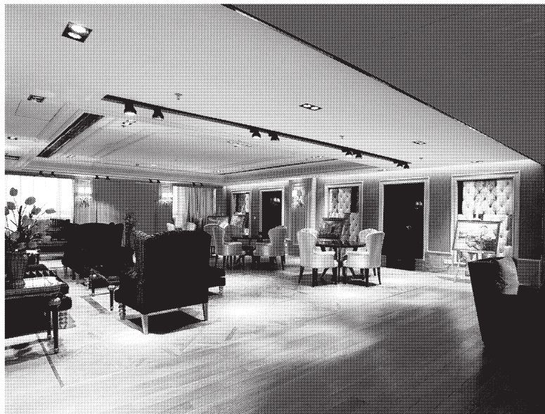
■ 同济经典精品设计体验中心 咨询电话：400-052-9866 官方网址：www.tongji021.com