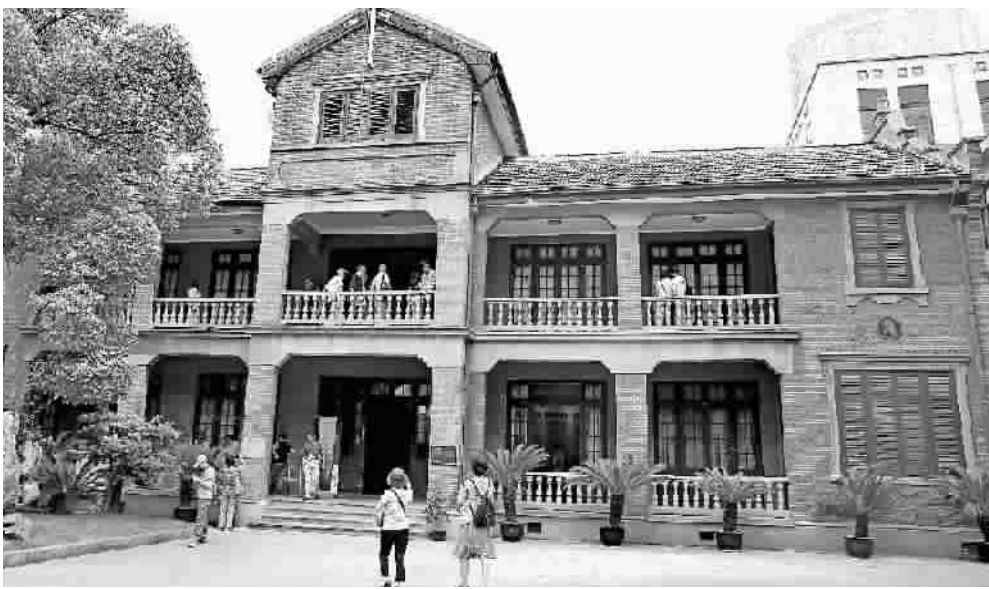
上海特别市政府旧址