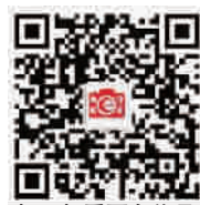
扫一扫看更多作品 和全部获奖名单

“2014上海花展”暨上海植物园建园40周年新老照片征集活动,让市民走进园林,更让摄影走进千家万户,为精彩的城市生活添上了美丽的一笔。