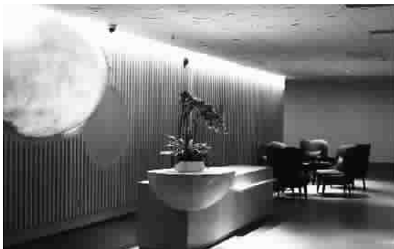
■ 产科病房外休息区