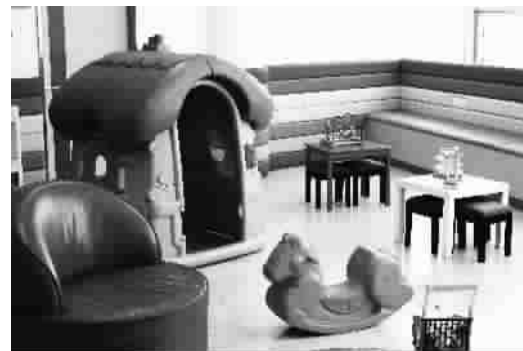
■ 儿科门诊儿童候诊区