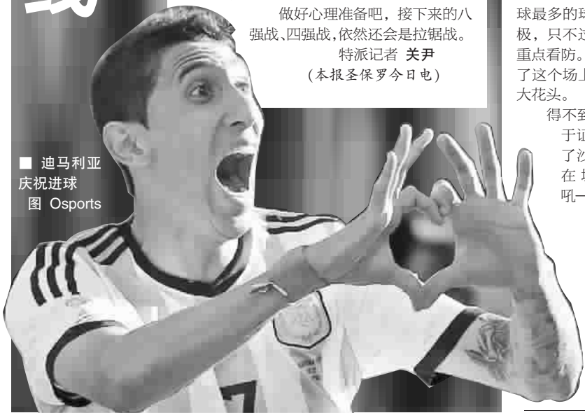
■ 迪马利亚庆祝进球