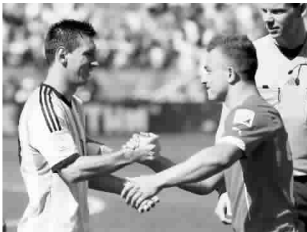
■ 梅西(左)和沙奇里惺惺相惜