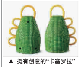
▲ 挺有创意的“卡塞罗拉”