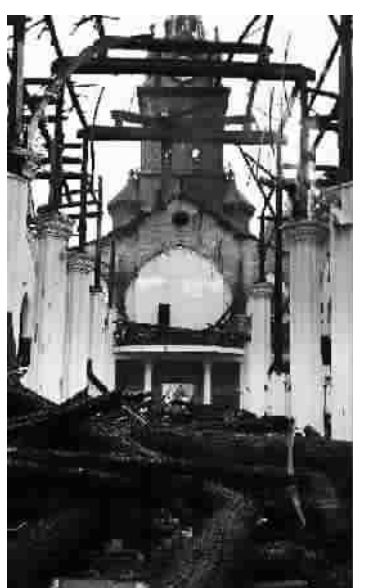
▲ 火灾现场 ▲ 宁波老外滩教堂是全国重点文物保护单位 ▶ 教堂损毁严重

本报讯 宁波消息:今天凌晨,位于宁波市江北区老外滩的国家级文物保护单位——天主教堂突发大火。当地消防出动11辆消防车赶赴现场处置,1时30分火情得到基本控制,2时30分火势基本扑灭,3时15分左右,火势完全扑灭。这起事故没有造成人员伤亡,但作为宁波的地标性建筑,教堂过火面积约500平方米,损毁严重。 据介绍,今天凌晨0时48分,当地消防接到报警:位于宁波市江北区中马路2号的宁波老外滩天主教堂发生火灾。