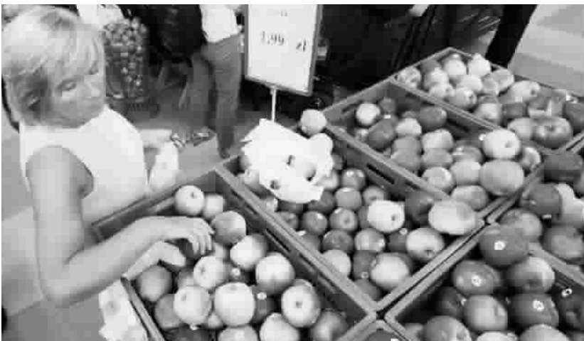
贸易禁令将使波兰苹果失去重要市场

俄罗斯消费者保护部门还起诉美国快餐业巨头麦当劳,说麦当劳一些产品不符合食品安全规定。这一部门一名女发言人说:“我们发现一些违规行为,让我们对整个麦当劳连锁店的安全和质量产生怀疑。”