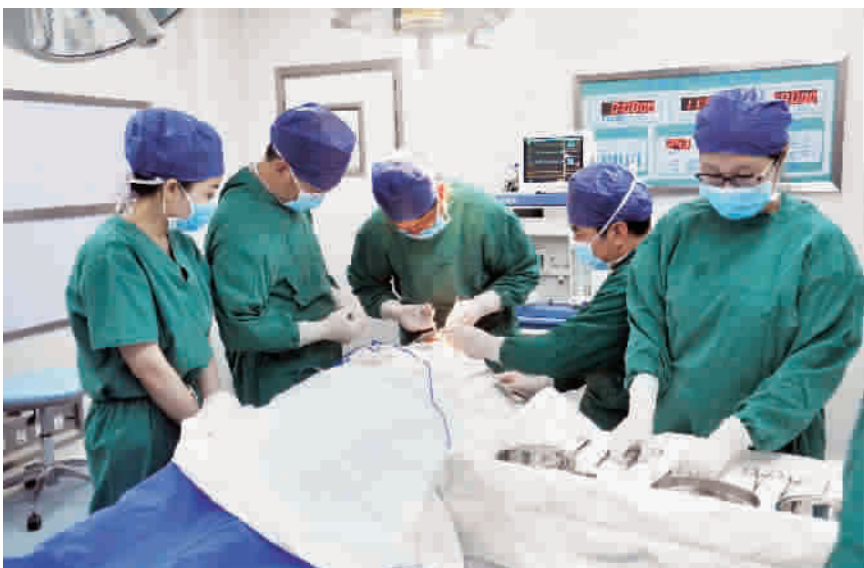
■ 上海伊莱美专家团队手术中