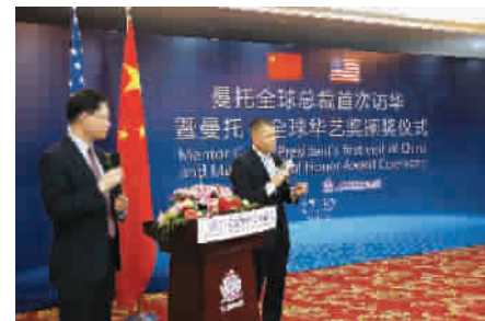
■ 全球知名隆胸假体公司曼托全球总裁

专科建设,并陆续引进世界顶尖人才,不断提升医疗质量、管理质量及服务质量。建设成为国内首家一站式美丽解决方案的医疗美容医院,是他们对于未来的美好规划。