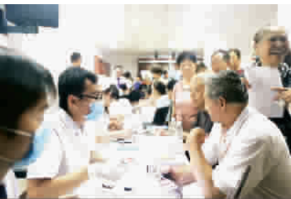
■ 伊莱美齿科为市民进行口腔咨询