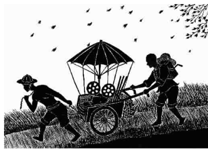
邵逸夫,华人影业大亨。祖籍宁波,16岁时与哥哥邵醉翁一起在上海创办天一电影公司,从学徒工开始,几乎干遍了电影制作全工种,1926年起担任导演。后又随哥哥一起转辗来到南洋,走村串巷放电影,克服了难以言表的各种困难,终于迎来了一个个发展良机。睡得地板,做得老板,是坚持成就了邵氏影业帝国。