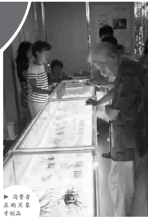
▶ 消费者在购买象牙制品

大多数象牙制品的背后，都是一头大象的生命。一场名为“保护·传承”的“海派象牙雕刻艺术展”从本月中旬至月底在上海工艺美术博物馆举办。每一块宣传展板的右上方，都印着一句自相矛盾的标语：“保护野生动物资源是公民的职责，传承海派牙雕技艺是文化的延续。”象牙雕刻展打出了“为了保护大象”的旗号，而展会这条没有逻辑的理由让人啼笑皆非。记者还在现场看到，虽然该展览证件齐全，合法获批，但产、销、订一条龙服务，明显是在鼓励而非限制象牙交易。