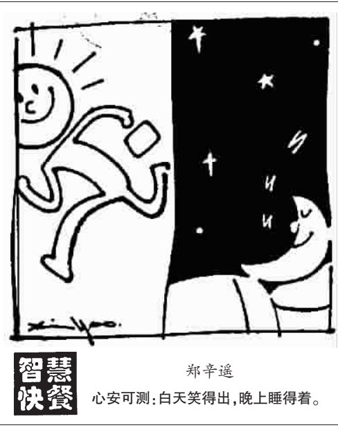
智慧快餐 郑辛遥 心安可测:白天笑得出来,晚上睡得着。

四川、浙江甚至不丹等国等地都有制造,材质仍以玛瑙为主,但工艺水平、加工质量最好的首推台湾。1996年春笔者去台湾省亲,发现不少店家有新工艺天珠卖。店主告知:有传一次特大空难中有两个幸存者,其中一个佩戴西藏老天珠。于是人们相信了天珠的神奇,在台湾掀起了天珠研究热和佩戴热。笔者以为工艺天珠无真假之分,如有人拿来一颗天珠来作鉴定,最合适的说法是告诉对方,这是天然九眼石的,还是某种工艺的天珠。古工艺天珠的断代很难,因缺少时代特征的标准器,倘若能说出点道道,推测出大致的年代,便已十分了得。