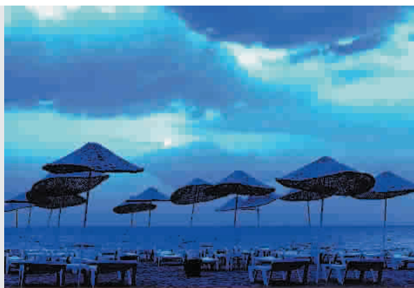
《暮色》冷调的剪影画面, 以表现宁静的效果