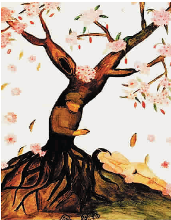
被夺走的纯洁 庆康德