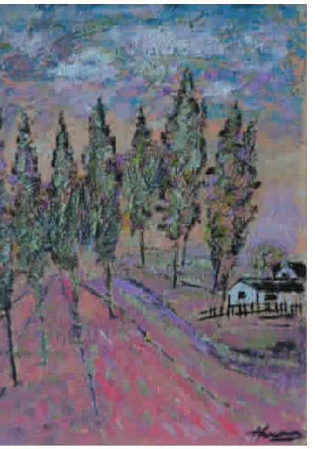
▲“像泥土一样生长”·奥尔威斯速写 (油画) 22x28cm

7月的法国，酷暑难忍，如果驾车去阿维尼翁偏僻郊野，会觉得怪怪的，但这种充满阳光的土地和农屋，透射出130年前有这几位印象派先者的背影，不少农田、器具、茅草屋、人物似乎一个个在僻静之处站着，也许我们不该仅仅带着窥视的猎奇心理，抑或是冰冷的欣赏眼光，他们对大自然的激情，多色更值得细细品读。