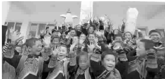
■ 汇添富基金援建的“添富小学”孩子们