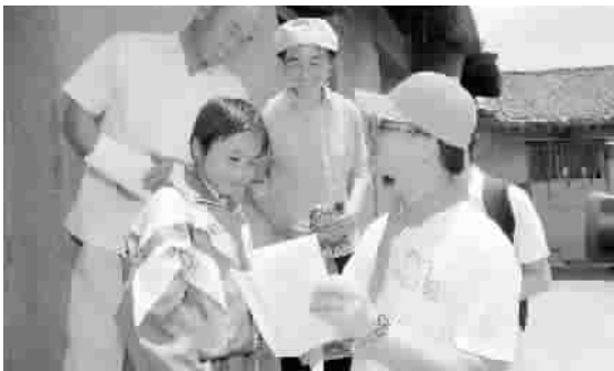
■ 汇添富基金领导走访贫困山区孩子

十年来,汇添富基金得以在市场多轮牛熊转换中,实现持续稳健的投资回报,得益于其在行业和公司研究方面的强大优势,已