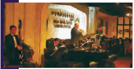
■ 上海·和平饭店爵士酒吧 Jazz Bar

旅游的本质是发现和体验,而无论发现和体验,这一切不再是为生存。你体验了很多,自然、人文、美食……而夜色中糅合了这些因素的某一特定的所在,让你微生醉意,沉静安然。这大体是旅游的又一种境界。 长三角城市群“主题+体验”系列旅游产品领导小组办公室、上海市旅游局市场推广处处长 沈超