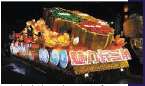
■ 长三角花车亮相 2014年上海旅游节开幕大巡游

金风送爽,丹桂飘香。十一黄金周让我们跟随专家视角去发现和体验“夜游”长三角令人心醉的20个地方和10个酒吧: