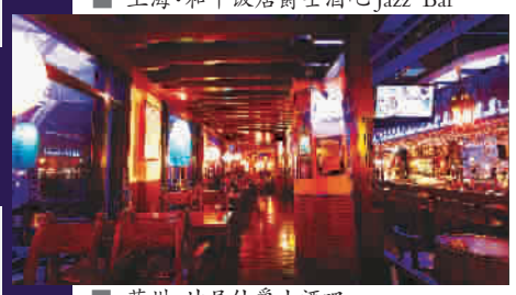
■ 苏州·甘尼仕爵士酒吧