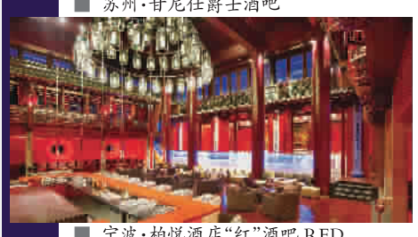
■ 宁波·柏悦酒店“红”酒吧 RED