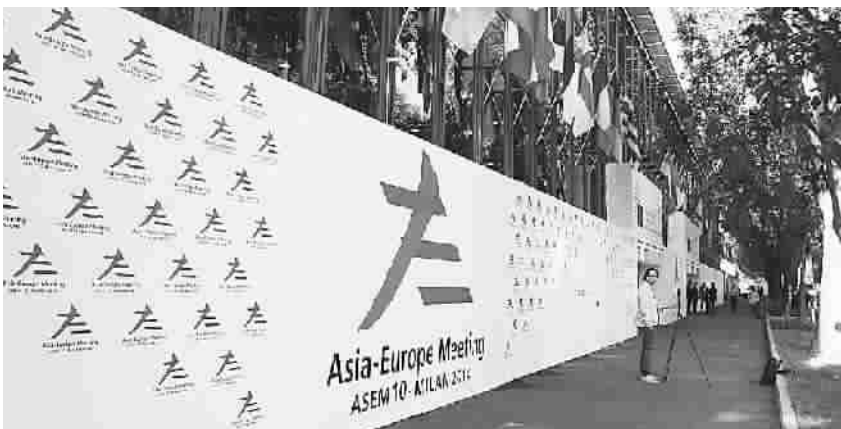
亚欧首脑会议今在米兰会议中心举行

简军波表示，中国政府在峰会上就推进亚欧互联互通提出进一步建议，李总理将重点介绍我国和平发展、包容发展的理念及“一带一路”构想(“丝绸之路经济带”和“21世纪海上丝绸之路”)，为解决全球和地区性问题贡献中国智慧和方案。